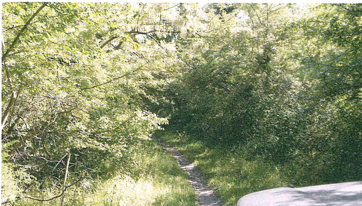
PARTICOLARE VIABILITA' FORESTALE ZONA NORD (LINEA VERDE)