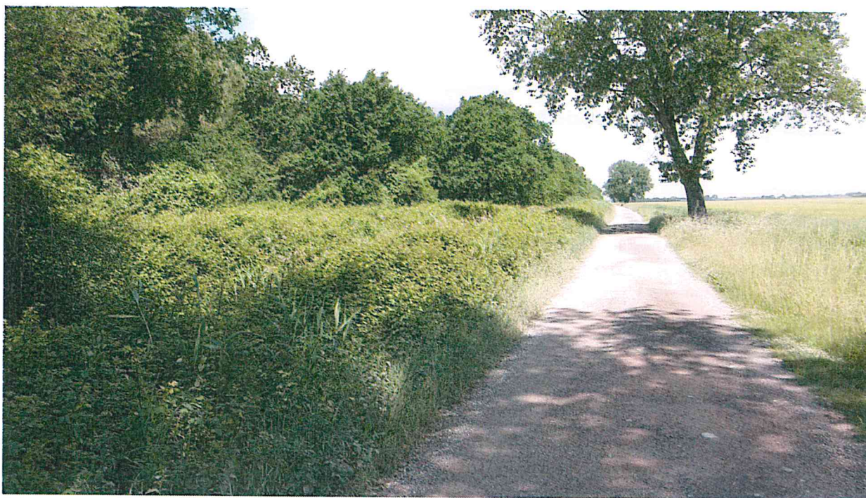
PARTICOLARE SPONDA DI CONFINE DELLA PINETA VISTA DA VIA DELLA SACCA (LINEA BLU)