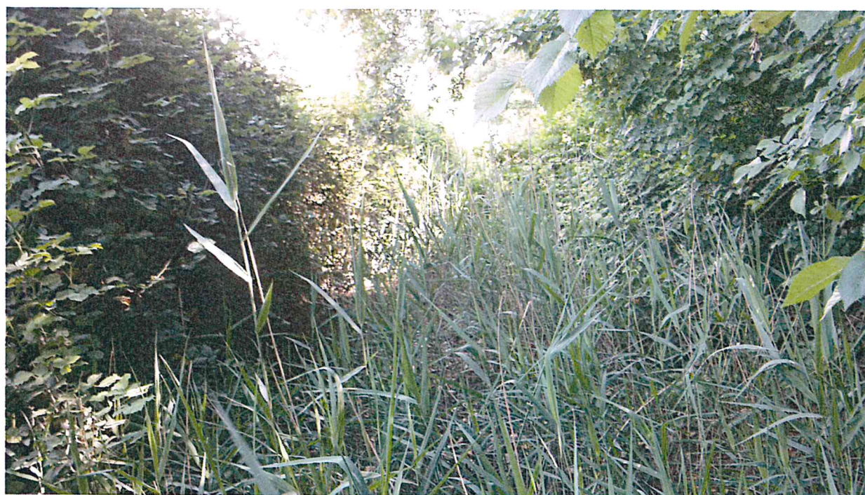
PARTICOLARE SPONDA DI CONFINE DELLA PINETA (LINEA BLU)