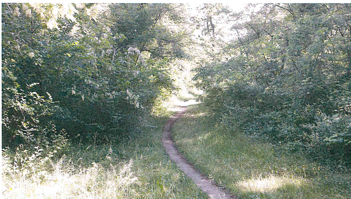
PARTICOLARE VIABILITA' FORESTALE ZONA NORD (LINEA VERDE)