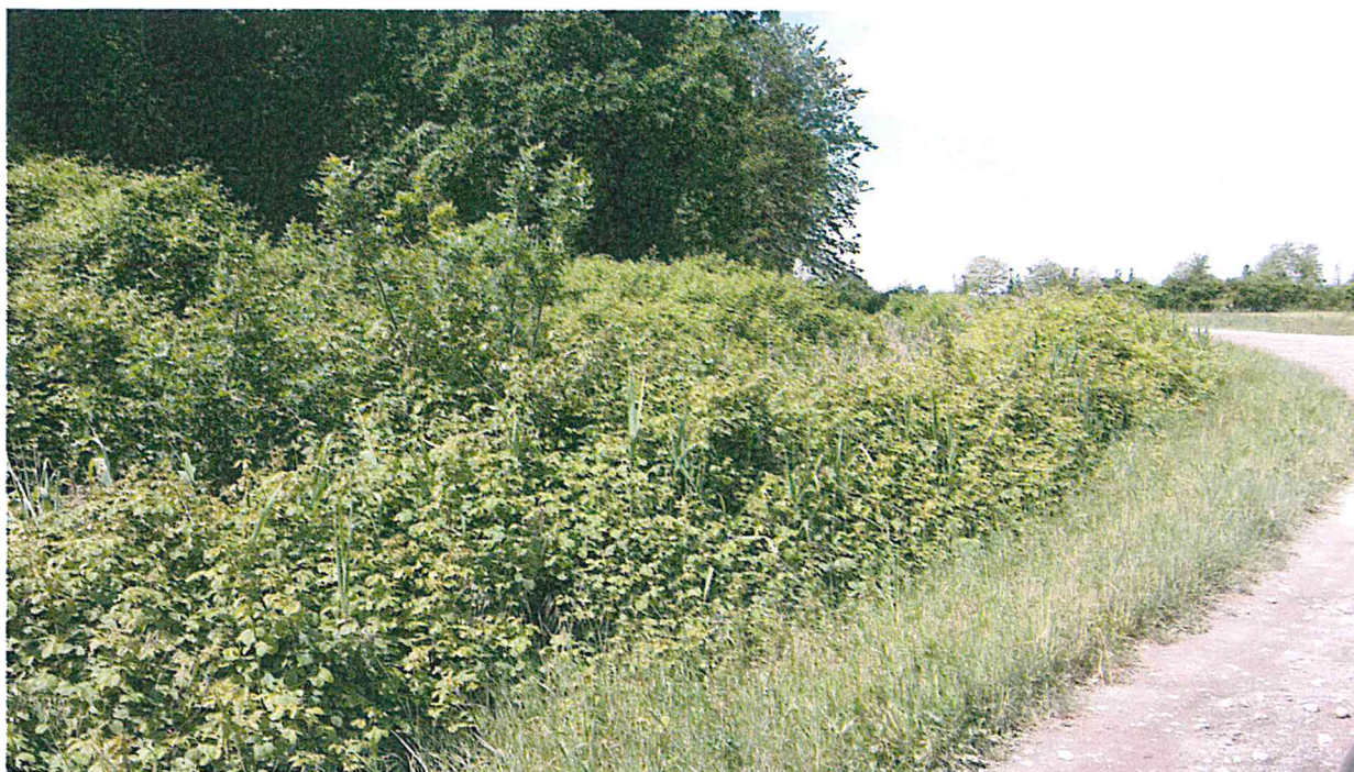
PARTICOLARE SPONDA DI CONFINE DELLA PINETA VISTA DA VIA DELLA SACCA (LINEA BLU)