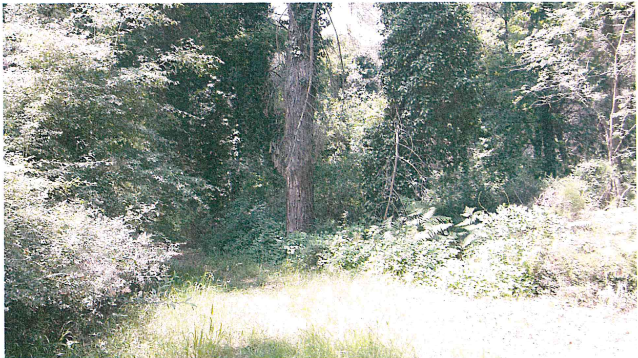
PARTICOLARE STAGGIO PERIMETRALE (VELATURA GIALLA)