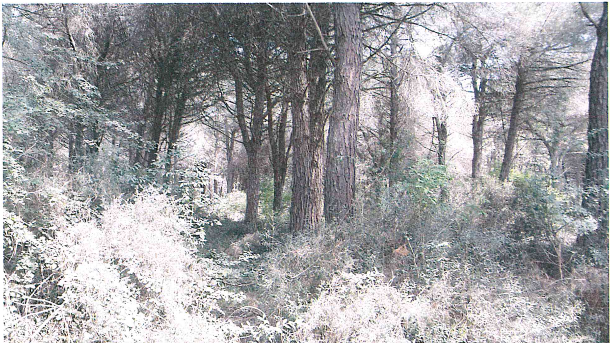
PARTICOLARE STAGGIO PERIMETRALE (VELATURA GIALLA)