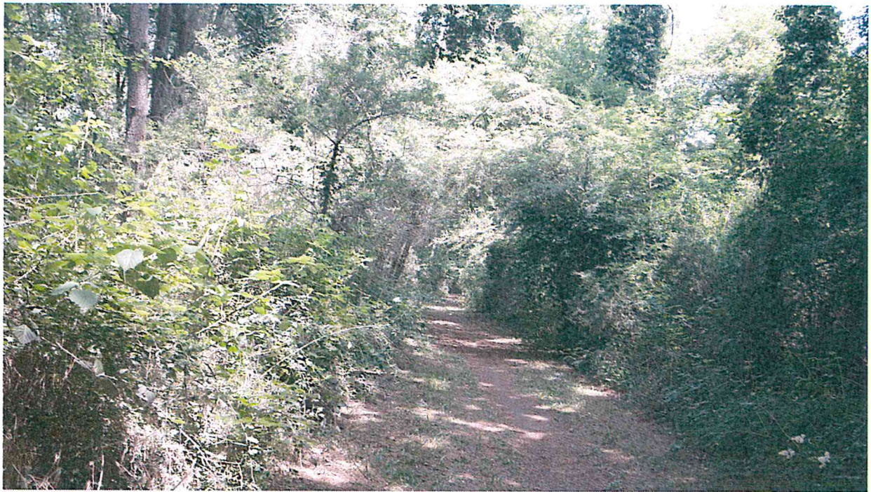
PARTICOLARE STAGGIO PERIMETRALE (VELATURA GIALLA)