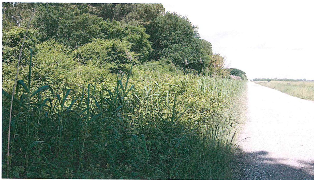
PARTICOLARE SPONDA DI CONFINE DELLA PINETA VISTA DA VIA DELLA SACCA (LINEA BLU)