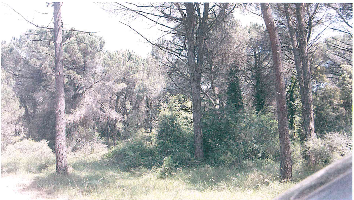
PARTICOLARE STAGGIO PERIMETRALE (VELATURA GIALLA)