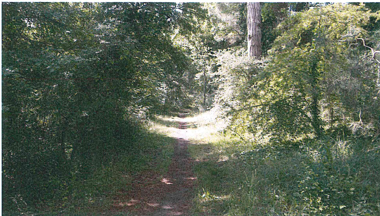
PARTICOLARE VIABILITA' FORESTALE ZONA NORD (LINEA VERDE)